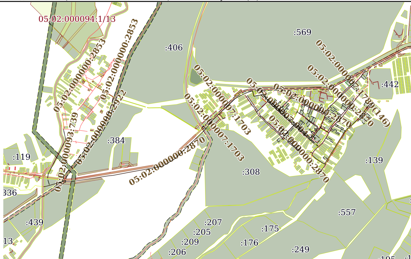
Схема расположения объекта недвижимости (части объекта недвижимости) на земельном участке(ах)